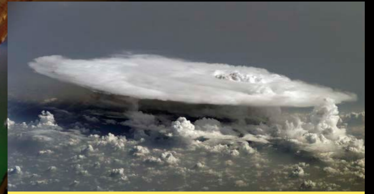
▲非洲西部上空 22 公里處的高空雷雲的頂部，是由冰晶聚集而成的圓盤狀結構。