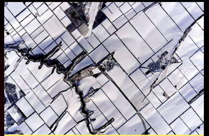
▲太空站經過俄羅斯上空時拍下的街景。被大雪覆蓋的街道，就像是格子狀的糖霜蛋糕。