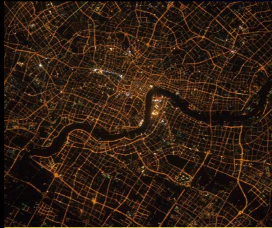
▲從國際太空站看到的上海夜景，像是黑皮膚透出的金色血管一般。